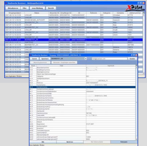
EDIFACT-Nachrichten im Klartext