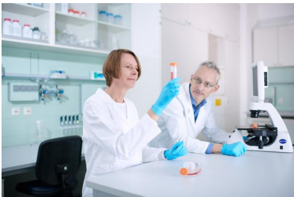
Mit 20 Jahren Erfahrung als Dienstleister für die Life Science-Industrie bietet trenzyme eine breite Palette an hochgradig maßgeschneiderten Dienstleistungen in der Zelllinienentwicklung und rekombinanten Proteinproduktion an.