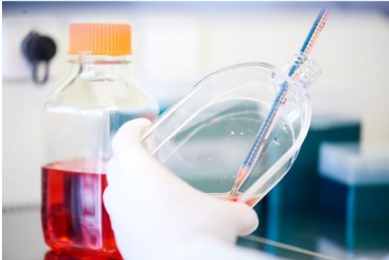
Herstellung von rekombinanten Proteinen in Zellen.