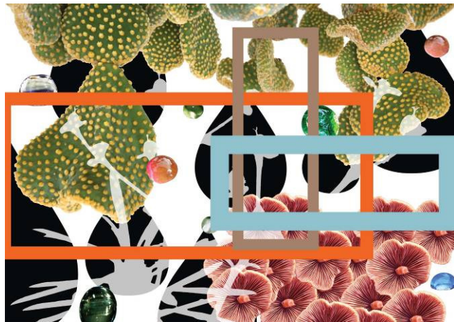
Jorge Pardo Untitled (4), 2012 Silksreen and inkjet on Belgian Linen 61 x 86,4 cm 34 x 24 inches Edition 15