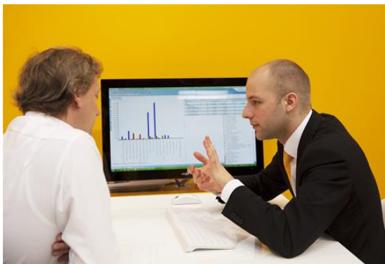
Bild: Software caniasERP auf der IT & Business 2015

Karlsruhe, 02. Oktober 2015. Der Karlsruher Software- und Beratungshaus IAS stellte 29.09. – 01.10.2015 sein Enterprise Resource Planning (ERP)-System caniasERP auf der Fachmesse für digitale Prozesse und Lösungen, IT & Business, in Stuttgart aus. Dieses Jahr beschreibt das Messteam die IT & Business als einen bunten Strauß an fachlich sehr unterschiedlichen Interessen und Anfragen sowie vertretenen Branchen und Ländern. Möglicherweise kam dies durch die Zusammenführung der drei Fachmessen CRM-expo, DMS EXPO und IT & Business in