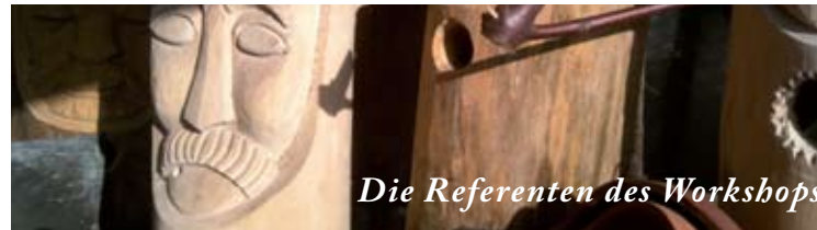
Die Referenten des Workshops

Ab 18 Uhr Grillen, Lagerfeuer & Live-Musik mit dem « Lene Krämer Trio »