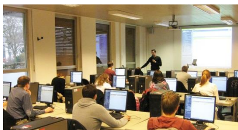
Bild: ERP-System caniasERP wird von der Uni Osnabrück für Übungszwecke eingesetzt

Zur Einleitung hielt Gastdozent Tomislav Zeljko, Beratungsleiter der IAS, einen Vortrag zum Thema „ERP im Mittelstand“ und beleuchtete dafür typische Anforderungen aus der Praxissicht. Nach der Installation des Systems erhielten Studenten einen Einblick in das caniasERP und wurden darin geschult. In den vier daran anknüpfenden Übungseinheiten haben die Teilnehmer den kompletten Zyklus – von der Stammdatenanlage und Disposition über Einkauf, Produktion und Bestandsführung bis hin zur Auslieferung – anhand eines Produktbeispiels direkt im System simuliert. Das Erlernete vertieften sie dann in einer selbstständig zu lösenden Fallstudie. Im Anschluss daran übergab die IAS 15 Studierenden das Zertifikat für die erfolgreiche Teilnahme an der caniasERP-Schulung und ihre Mitarbeit.